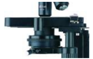
滑入式聚光鏡,可調整 中心位置