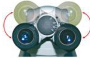
接目鏡筒可向上旋轉180° 提升眼點水平高度,以符 合不同身高人員使用