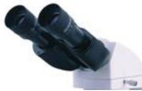
超大視野廣角目鏡 可調兩眼視差裝置