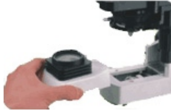
磁鐵吸附式燈源外罩 更換燈泡更便捷安全