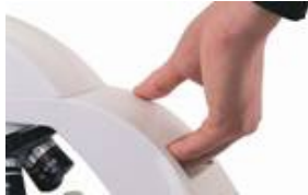
機背握把手設計,搬動 更輕鬆方便